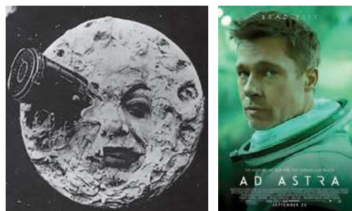
Figura 1. De A Viagem à Lua , de Georges Méliès (1902), a Ad Astra , de James Gray (2019), muito mudou: a narrativa, os efeitos especiais... Algo em comum permanece: a ambição humana universal de sair de nosso planeta em direção ao espaço e o medo do incerto.

Devemos então imaginar que as viagens espaciais serão cada vez mais rápidas: será que um dia poderemos passar o Natal em casa de um filho que mora em Marte e