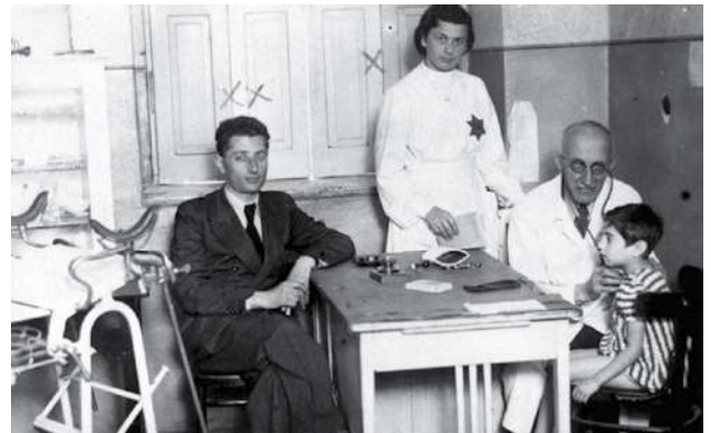
Figura 1. Imagem dos guetos judaicos durante a segunda guerra, organizados pelos Conselhos Judaicos Locais. Esquerda: Polícia judaica no gueto de Varsóvia. Direita: Clínica médica no gueto de Będzin, Polónia.

serviam apenas para indicar o número de pessoas que iriam receber a alimentação. A quantidade total de comida disponível era controlada e independente do número de moradores: de nada valia tentar aumentar artificialmente o número de bocas a alimentar. Assim, estes, cuidadosamente registados, fornecem uma excelente aproximação da quantidade de habitantes em confinamento.