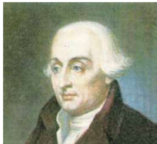
Joseph-Louis Lagrange (1736–1813)

J oseph-Louis Lagrange nasceu em Turim, em 1736, e faleceu em Paris, no ano de 1813. Entre essas duas datas, contribuiu como poucos para o desenvolvimento de inúmeras áreas da matemática. Esta é a sua história.