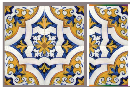
Figura 13: BAAB