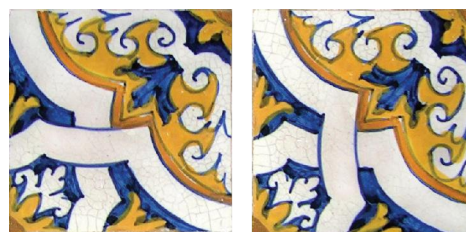
Figura 3: A e B