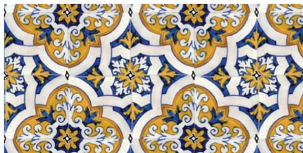
▼ Figura 8: Centros de ordem 2 e 4

centros de rotação 2 , assinalados na figura 8 respetivamente com os símbolos \blacklozenge e \blacksquare . De onde é que surgiram estas simetrias adicionais no primeiro caso, se só usámos translações em ambos os casos? Uma simples análise das figuras permite encontrar a resposta: o desenho no quadrado de quatro azulejos usado no primeiro padrão tinha, ele mesmo, uma simetria de rotação de grau 4 com centro no próprio centro do quadrado. Isso implicou que o padrão tivesse como simetrias, não só as rotações de grau 4 com centros em todos os trasladados, mas também outras rotações resultantes da existência daquelas e das translações (ver figura 8).