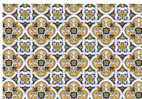
Figura 14: BAAB (** ou pm)