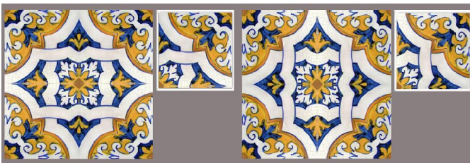
Figura 11: ABAB e BABA