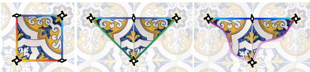
Figura 9: Regiões fundamentais de formas diferentes (442 ou p4)