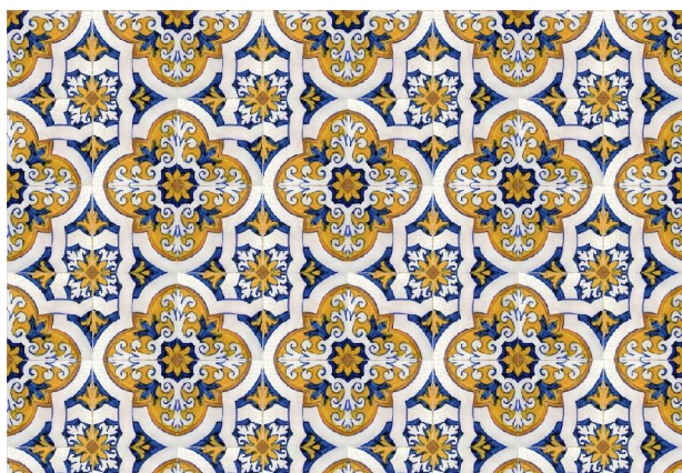
◀ Figura 7: BAAA (o ou p1)