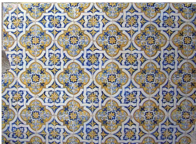
Figura 1: Painel de Azulejos

vertical, e queremos colocar quatro azulejos, um em cada quadrante, de forma a que cada um desses azulejos, de tipo A ou B , encoste à origem o seu vértice que, na figura 3, aparece à esquerda, em baixo. Por exemplo, começando no 1.º quadrante e correndo os restantes no sentido contrário ao dos ponteiros de um relógio, as configurações mostradas na figura 2 correspondem às escolhas dos azulejos BAAA e ABAB , respetivamente.