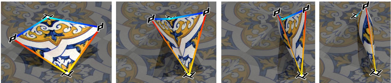
Figura 10: Formação da almofada triangular (triângulo retângulo isósceles – p4 ou 442)