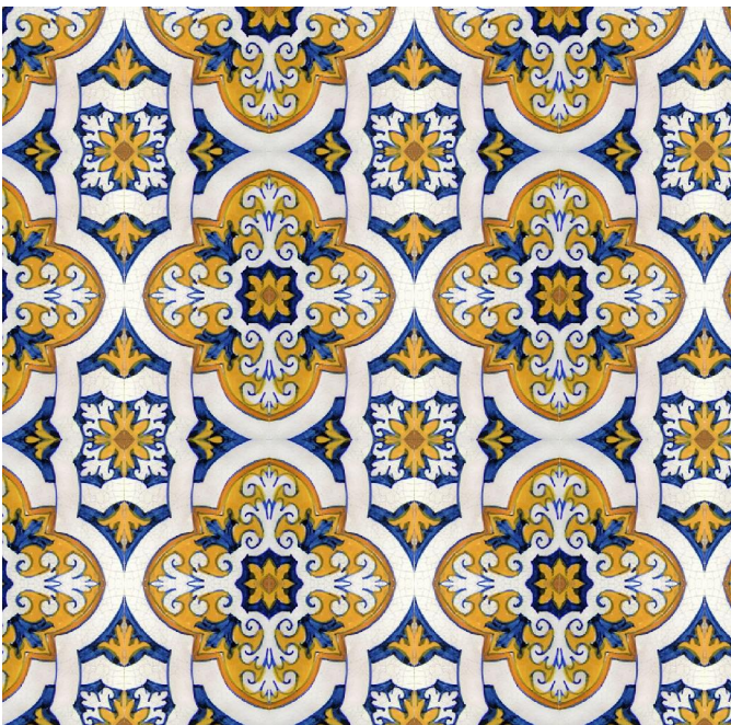
Figura 12: Padrão correspondente a BABA (*2222 ou pmm )

Essa “almofada triangular” é característica desse tipo de simetria, designado por p4 ou 442, conforme o sistema de notações, e pode ser utilizada como uma espécie de carimbo para obter todo o padrão (ver [1]). A figura 10 mostra diversas fases na formação do carimbo referido.