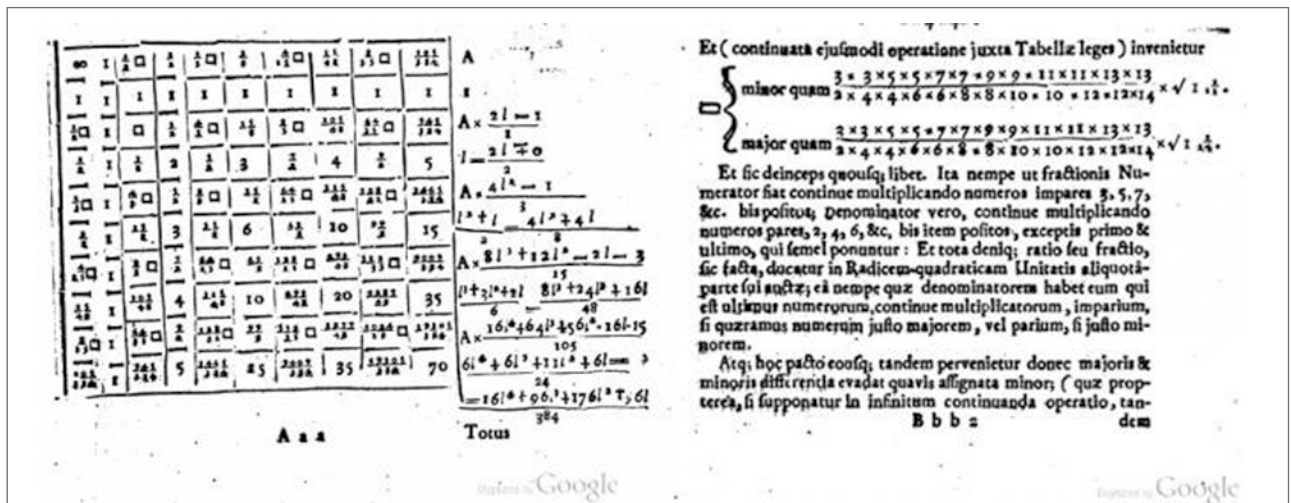
Figura 2. Imagem do livro Arithmetica Infinitorum por John Wallis (Oxford, 1655). No texto à esquerda, o símbolo \square refere-se a 4/\pi .

A equação básica da mecânica quântica é a equação de Schrödinger, uma equação das derivadas parciais envolvendo o tempo e as variáveis espaciais. O conjunto dos valores próprios da parte espacial da equação é o