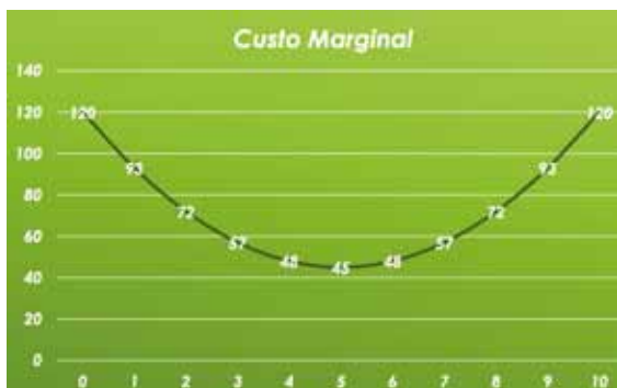
Figura 1. Representação gráfica da função de custo marginal dada.