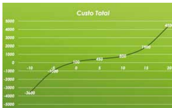
Figura 2. Representação gráfica da função de custo total determinada.

Discutimos depois os motivos, salientando que não se tratava de mostrar igualdades entre funções, mas antes igualdades entre famílias de funções. De facto,